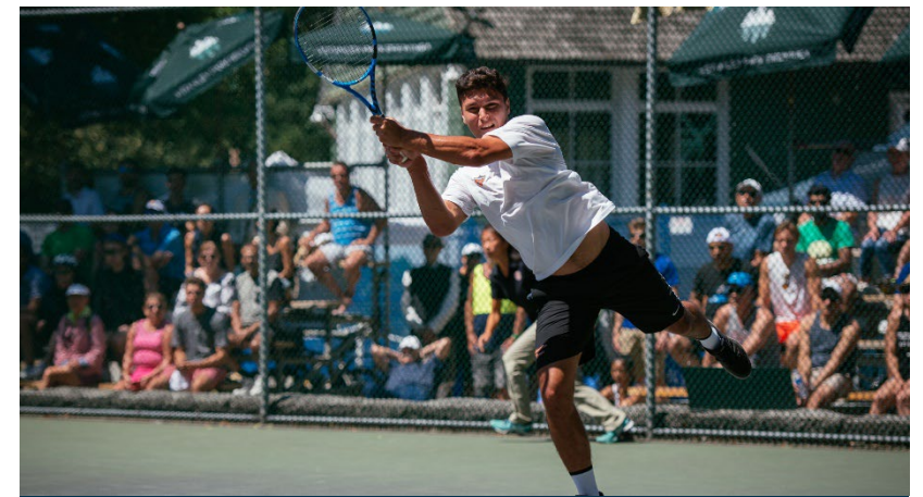
TOURNOIS OPEN 1000