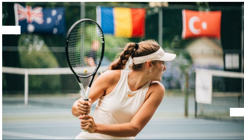
TOURNOIS JUNIORS ITF